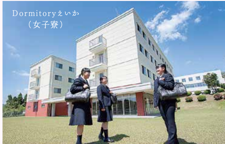
Dormitory えいか (女子寮)

全校生徒の約3分の1が寮に入っています、規律と秩序ある集団生活を行う一方で、家庭的な温かさの中で、それぞれの自主性を伸ばします。